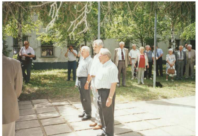
Nagysándor József szobrának megkoszorúzása

A megemlékezés koszorúját helyeztük el a névadó, Nagysándor József szobránál, majd az emlékszoba megtekintésére került sor. Közös ebéddel, baráti beszélgetéssel a múlt emlékeinek felidézésével fejeződött be e jó hangulatú találkozó.