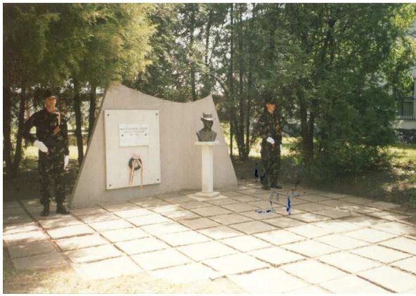
Nagysándor József emlékhely (székesfehérvári híradó laktanya)