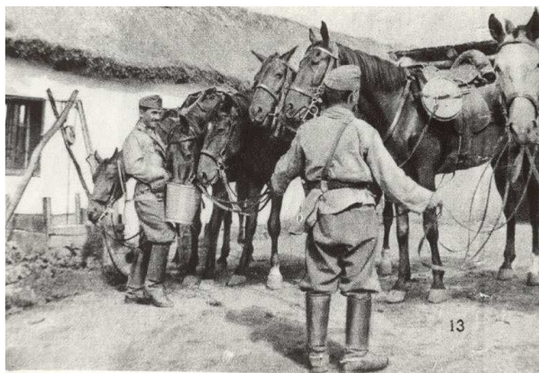
Itatás a híradóknál

Amióta megjelent az élet a földön, azóta létezik a hírközlés. Mechanikus - értem alatta - fizikális vagy láthatatlan bioelektromos módon történik a jelek átvitele-átadása, azaz közlése a másik élőlényvel (sejtek).