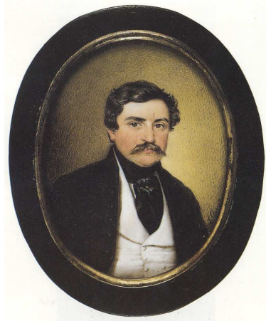
Deák Ferenc (1940-es évek)

Akik a győri csatában részt vettek, a vereségtől függetlenül a polgári életben jelentős szerephez és elismeréshez jutottak. Nedeczky István , Deák unokaöccse 1848-49-ben honvéd huszárszázadosként harcolt. Várfogsága után 1861-től országgyűlési képviselő, és a megalakult Honvéd Egylet elnöke lett. Deák Ferenc ről fennmaradt egy jelentkezési lap, melyben, 1781-ben kérte felvételét a bécsi nemesi testőrségbe. Tehát foglalkozott a katonai pálya lehetőségével is.