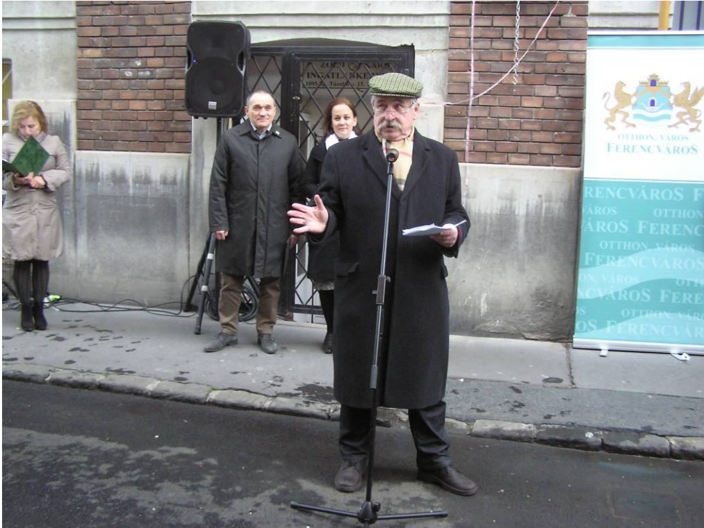
Laci bácsi „löki a rizsát”