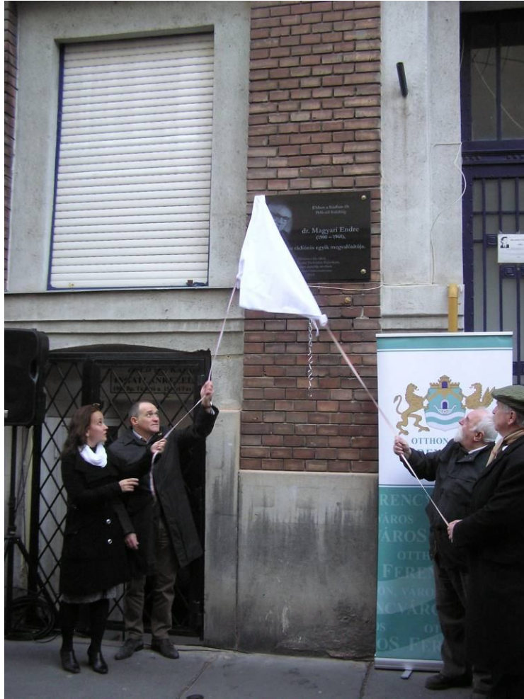
Lehull a lepel