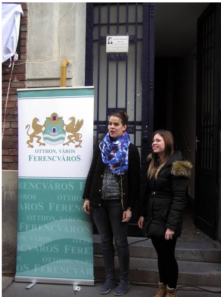
A IX. ker. kórusa